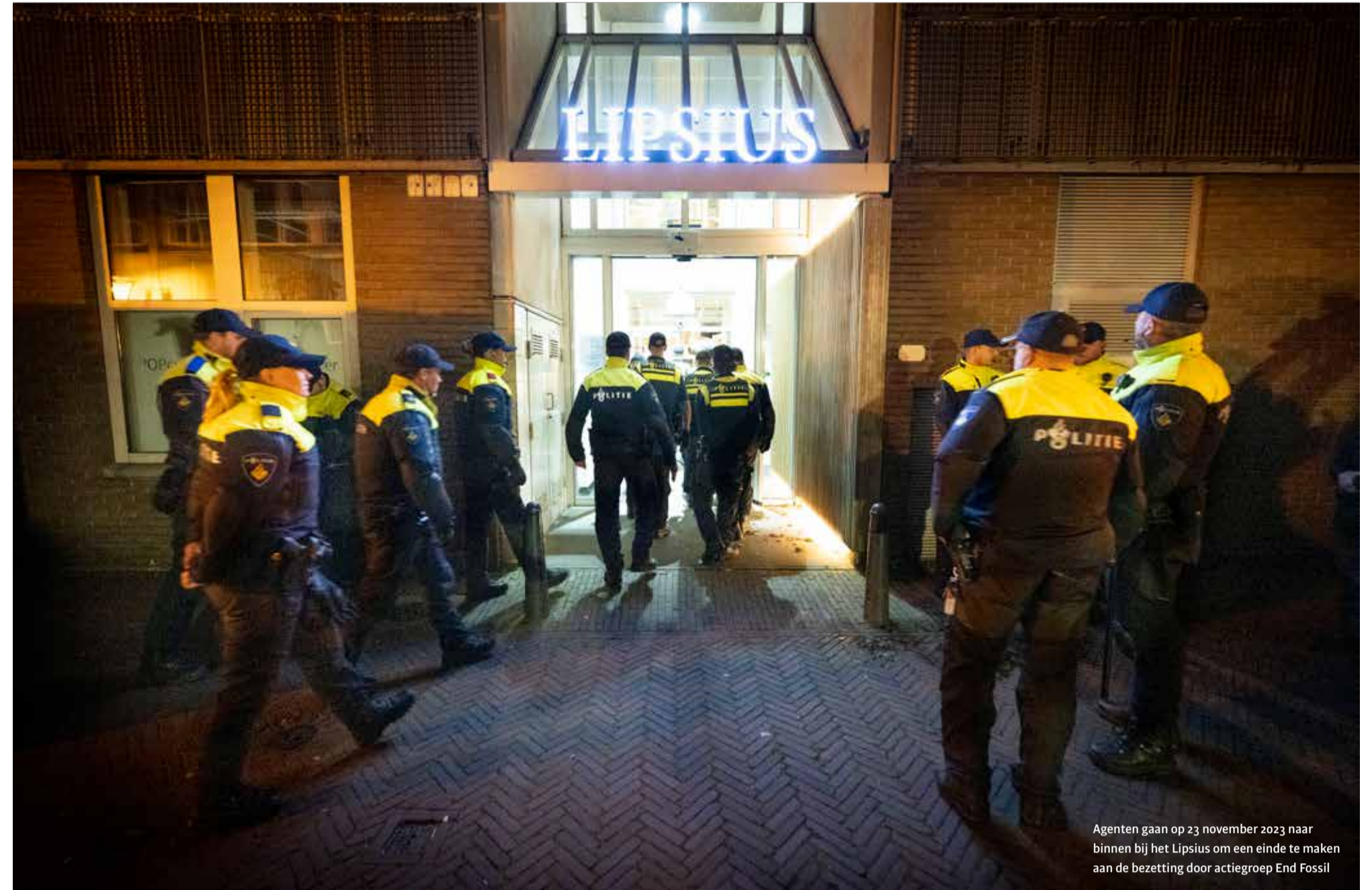
Agenten gaan op 23 november 2023 naar binnen bij het Lipsius om een einde te maken aan de bezetting door actiegroep End Fossil