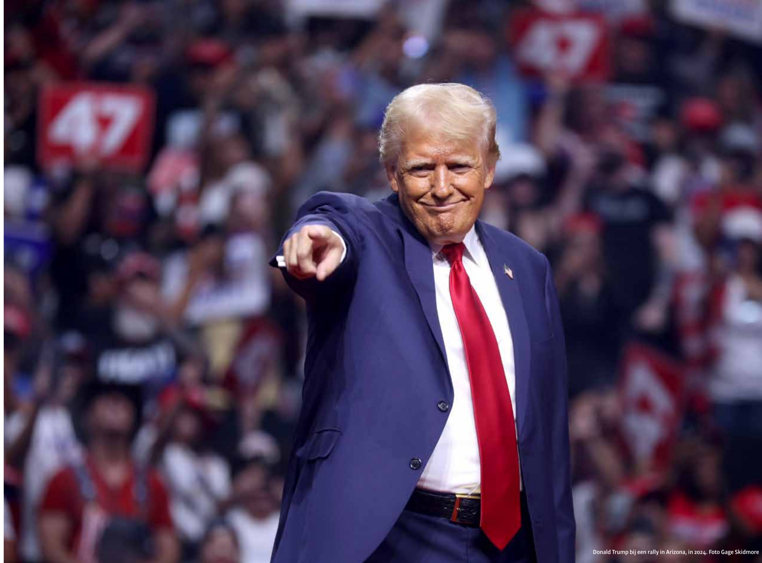
Donald Trump bij een rally in Arizona, in 2024.

Het bleef onduidelijk of de studenten nu een positief advies wilden geven of niet. Een dag na de vergadering mailt Molier aan Mare dat in een gesprek met leden van de personeels- en studentengeleding, de decaan en de vice-decaan 'er wat onduidelijkheden zijn weggenomen die te wijten waren aan het proces voorafgaande aan de vergadering'. De mail is mede ondertekend door Boutens. 'Floris-Jan en ik hechten eraan te zeggen dat de faculteitsraad als geheel achter de nieuw ingeslagen weg staat.'