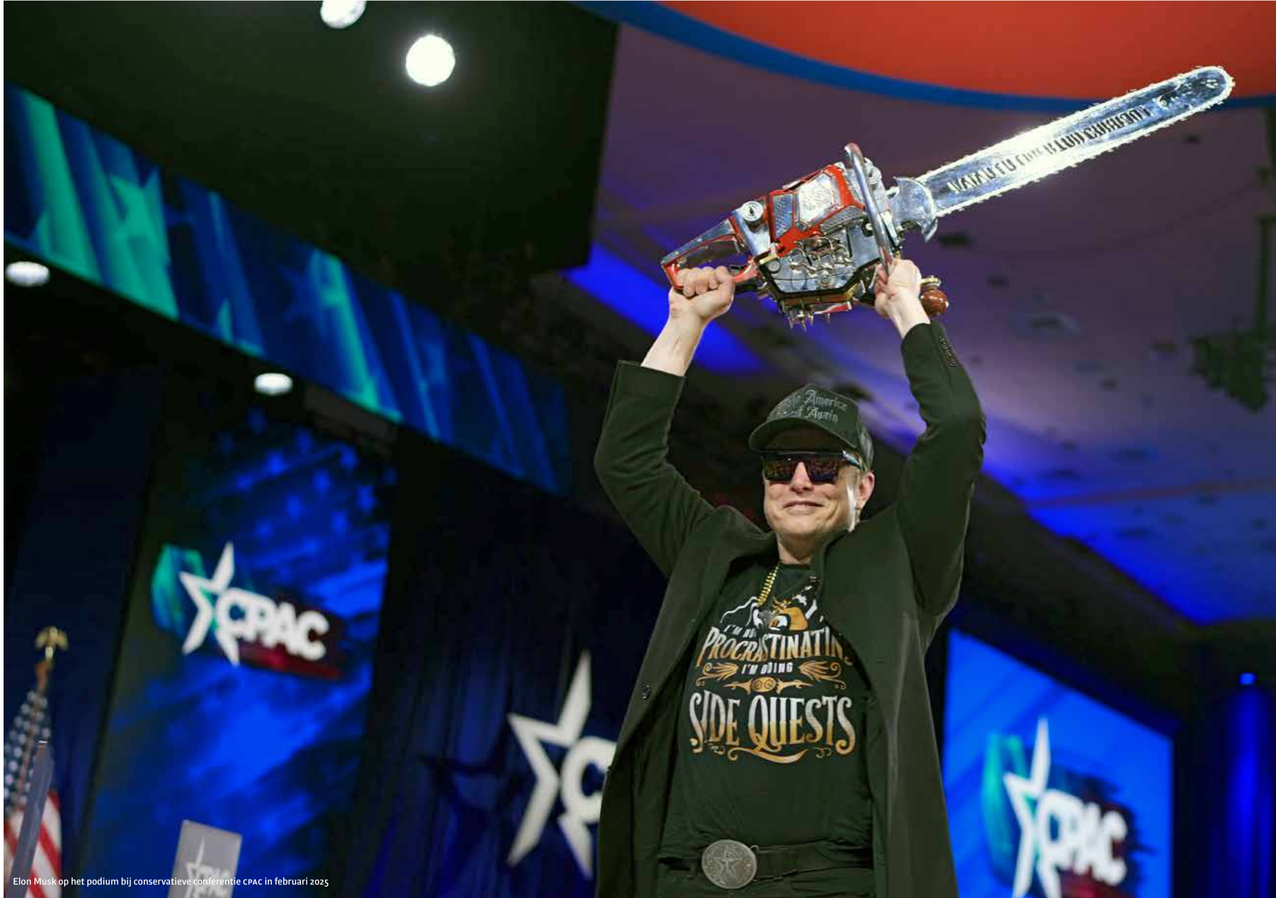
Elon Musk op het podium bij conservatieve conferentie CPAC in februari 2025

Een politieke aanval op de academische vrijheid in de vs, symposium, Kamerlingh Onnes Gebouw, vrijdag 4 april 16:00 - 17:30 uur