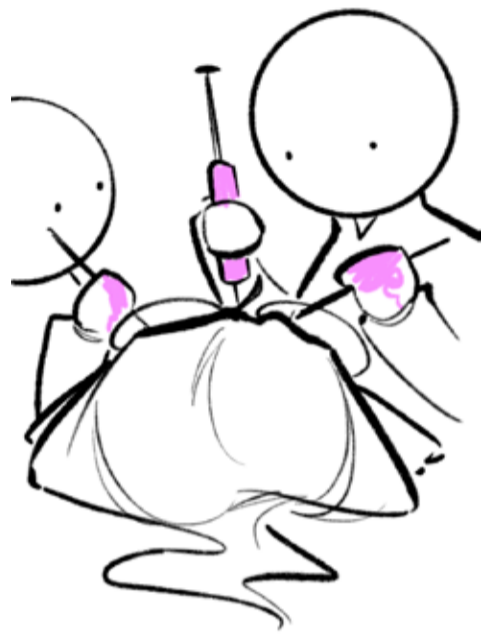
De illustraties op deze pagina maakte Ilse van der Putten om vrienden en familie op de hoogte te houden van haar ziekteverloop

Ondanks de diagnose kanker wilde Ilse van der Putten niet stoppen met studeren. Maar behalve een gevecht met de ziekte werd dat – ondanks welwillende docenten – ook een strijd met 'het systeem'.