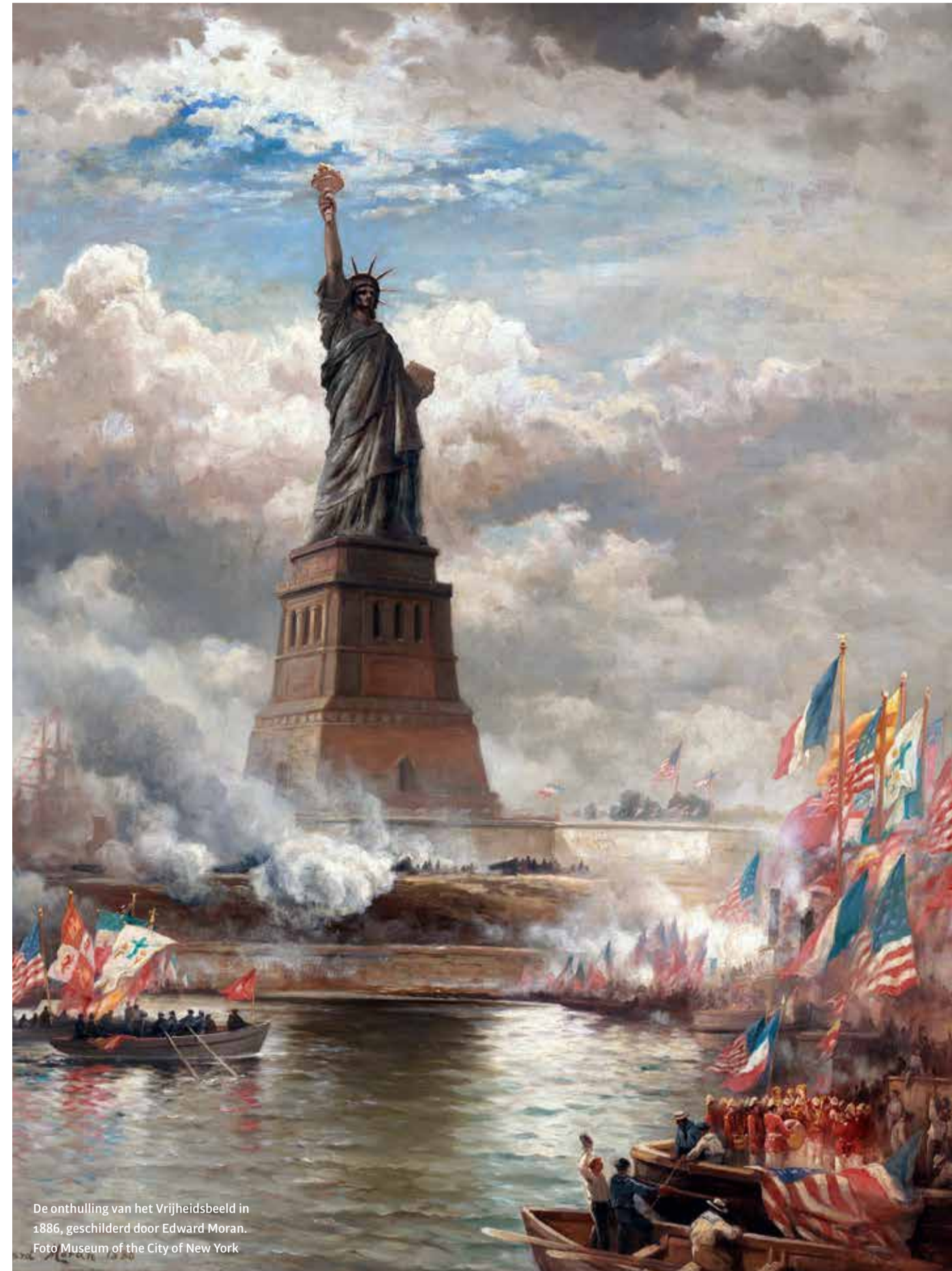
De onthulling van het Vrijheidsbeeld in 1886, geschilderd door Edward Moran.