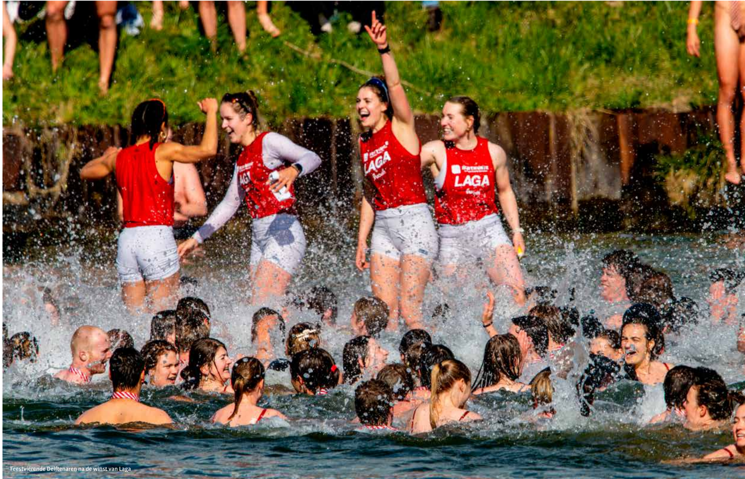
Feestvierende Delftenaren na de winst van Laga

Pas op het laatste moment mochten supporters van Njord en Nereus hun teams aanmoedigen bij de belangrijkste roeiwedstrijd van het jaar. In plaats van de gevreesde escalatie was er vooral verbodering. ‘Het belangrijkste is nu de relatie herstellen.’