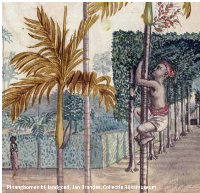
Pinangbomen bij landgoed, Jan Brandes. Collectie Rijksmuseum

'Wij vieren dit jaar het 450-jarig bestaan van de universiteit, maar ik denk dat wij alleen maar de geschiedenis kunnen vieren als we ook die andere realiteit van dat 450-jarig bestaan onder ogen zien. Zaken die niet goed zijn te praten. Ook dat hoort bij onze 450 jaar geschiedenis.' Zowel de burgemeester als de voorzitter zegden toe nog met een uitgebreidere inhoudelijke reactie op het rapport te komen op een later moment. 'Dit verhaal krijgt een vervolg', aldus Ottow. Het Leids Universitair Medisch Centrum heeft al aangekondigd een onderzoek te starten naar de anatomische collectie.