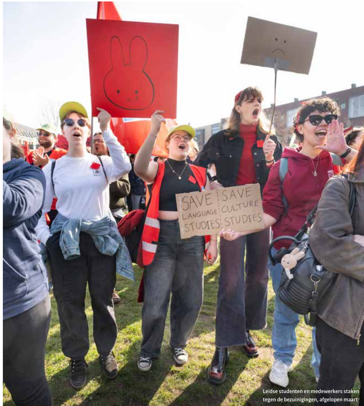
Leidse studenten en medewerkers staken tegen de bezuinigingen, afgelopen maart