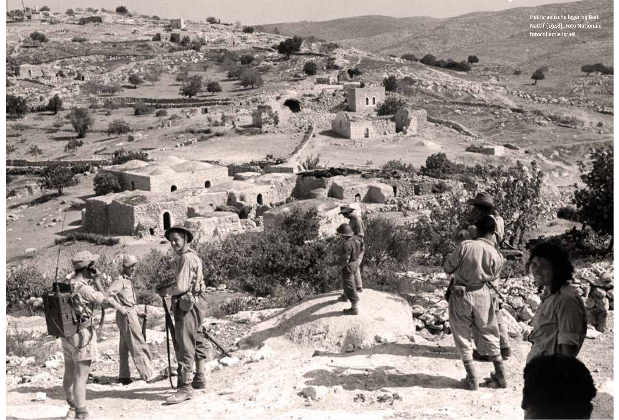
Het Israëlische leger bij Beit Nattif (1948).