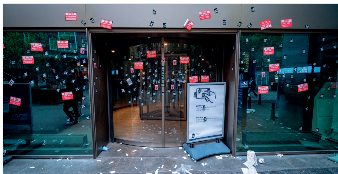
Controles Bestuur blijft zwijgen over strenge beveiliging en wil ook niet zeggen of u-mails worden bekeken. 'Ik heb openbaarheid gegeven in een vertrouwelijke vergadering'