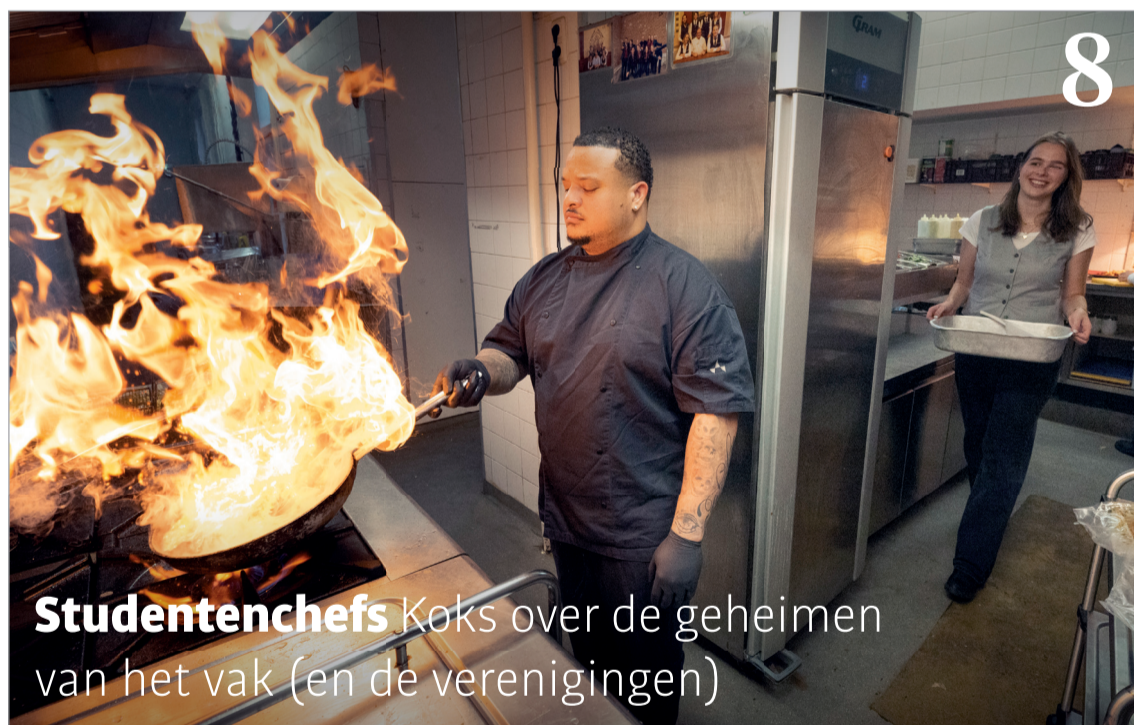
Studentenchefs Koks over de geheimen van het vak (en de verenigingen)