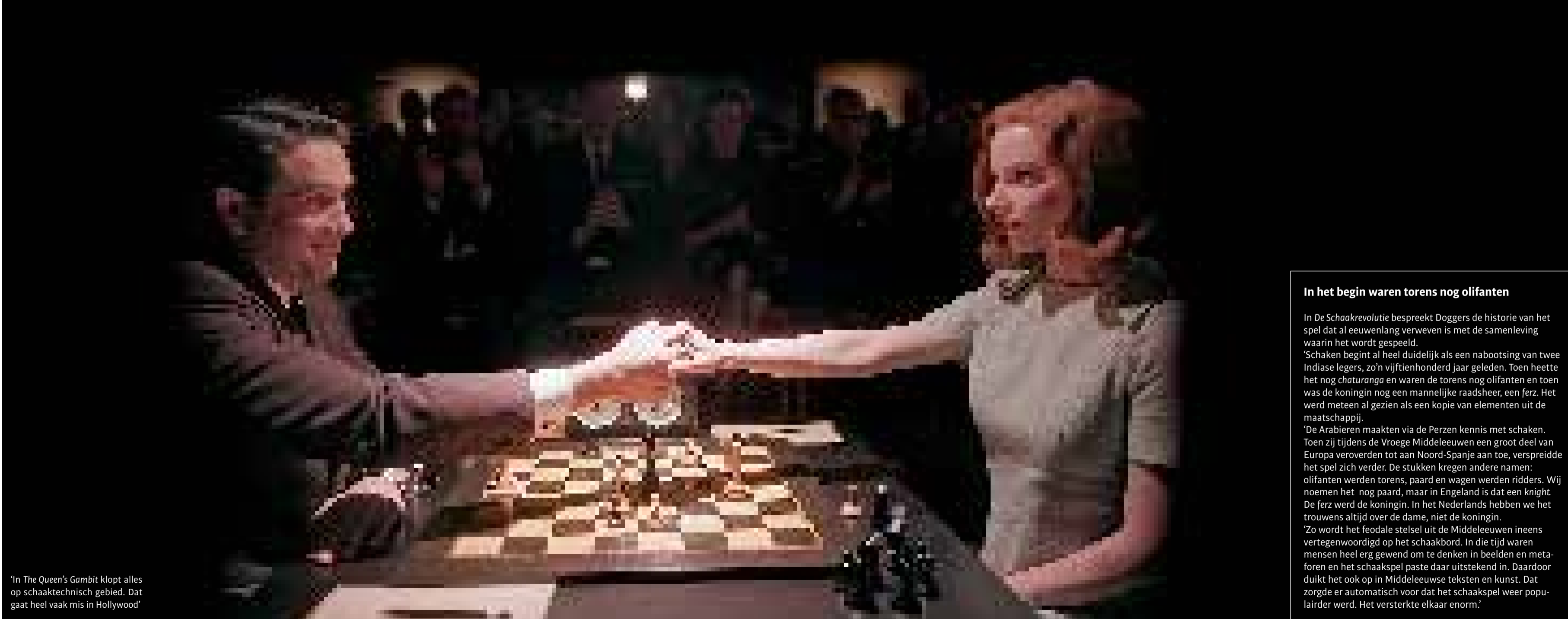
'In The Queen's Gambit klopt alles op schaaktechnisch gebied. Dat gaat heel vaak mis in Hollywood'

'In mijn eigen spel ben ik aanvallend ingesteld, best agressief. In de vierendertig jaar dat ik schaak, open ik met wit altijd met de koningspion, twee naar voren. Als ik met zwart speel, reageer ik daar altijd op door de pion voor de looper naast de dame twee naar voren te zetten. Die twee zetten vormen de Siciliaanse opening, mijn favoriet.'