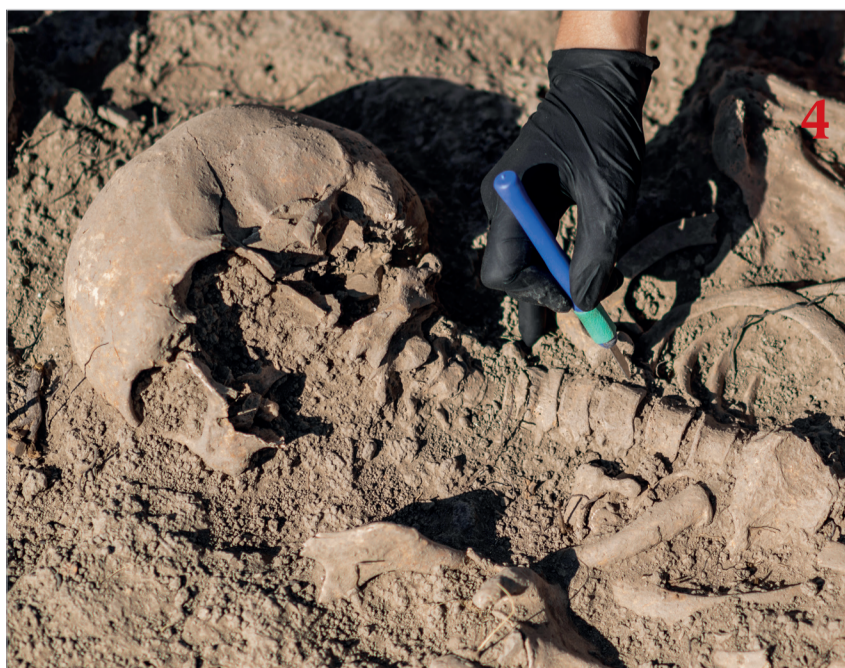
Affaire Hofman In de rechtszaal ging het hard tegen hard. Naast wangedrag kwam de universiteit met een nieuw verwijt: kinderarbeid