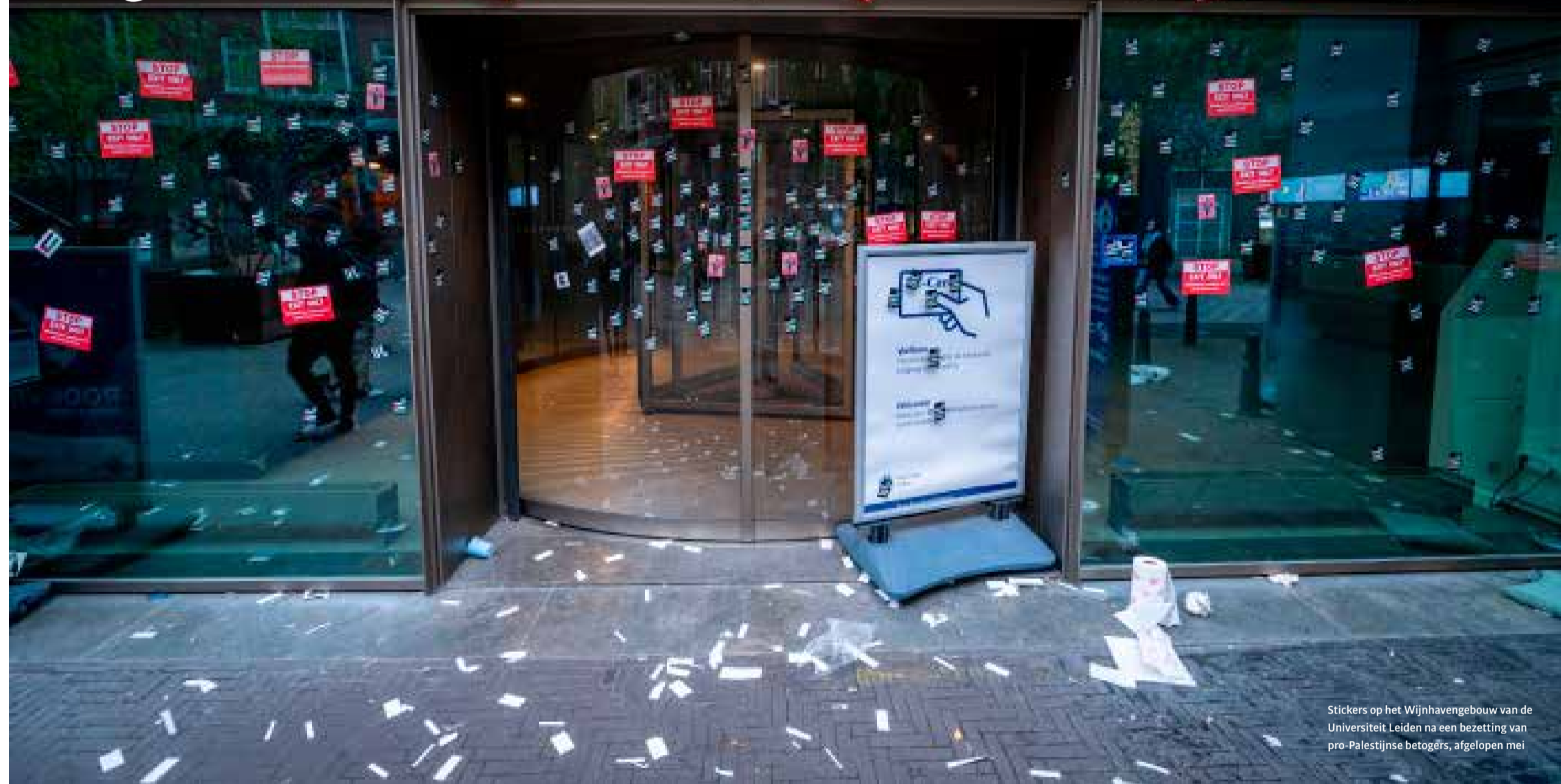
Stickers op het Wijnhavengebouw van de Universiteit Leiden na een bezetting van pro-Palestijnse betogers, afgelopen mei

Ondanks opgevoerde druk van de universiteitsraad bleef het college van bestuur zwijgen over opgeschaalde controles waarbij ook beveiligers in burger worden ingezet. 'Er is een ontzettend wantrouwen bij studenten en medewerkers.'