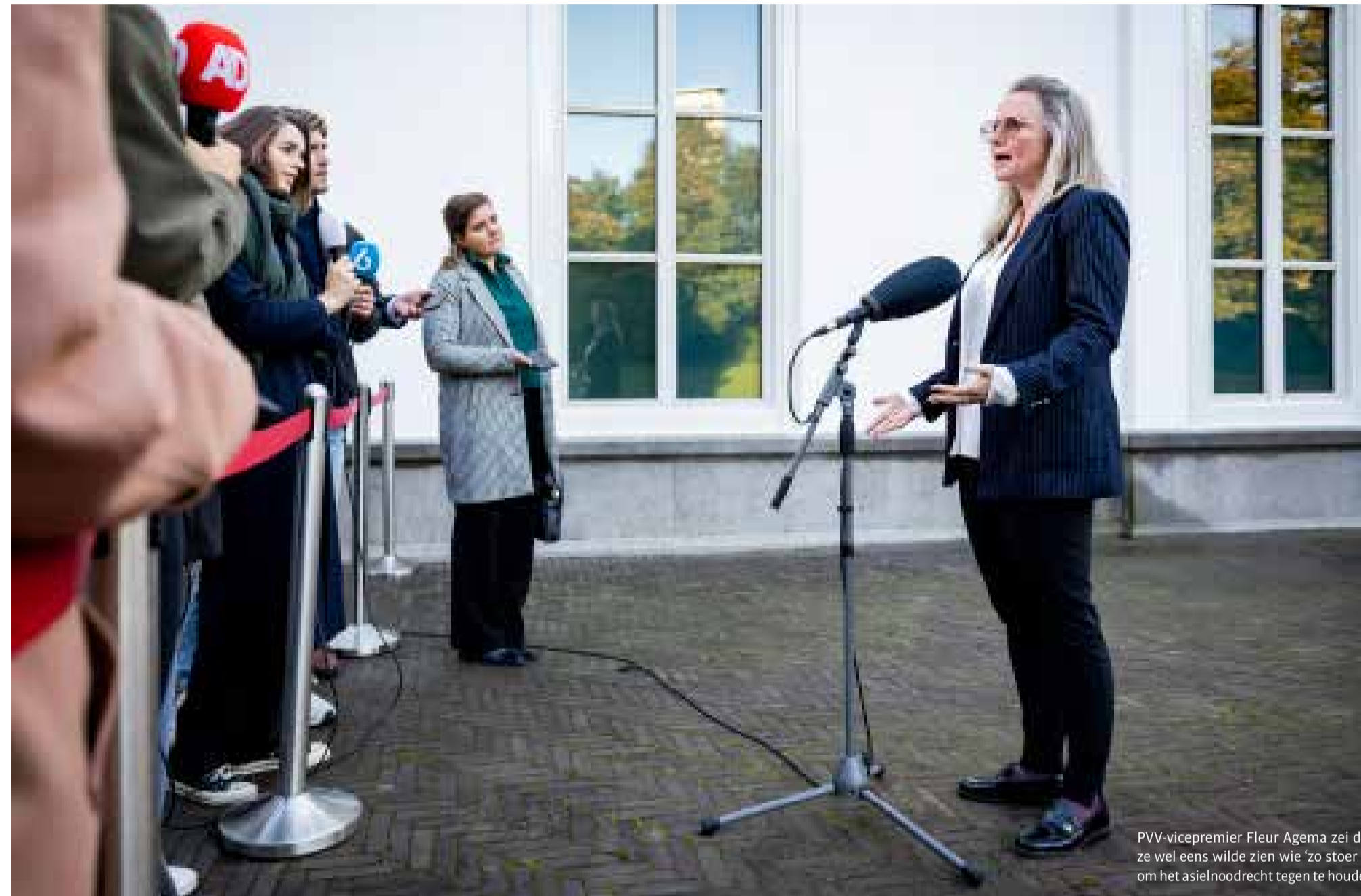
PVV-vicepremier Fleur Agema zei dat ze wel eens wilde zien wie ‘zo stoer is’ om het asielnoodrecht tegen te houden

Hoe red je jezelf na een dubieuze uitspraak of onhandige tweet? In het boek Maar ZO bedoelde ik het niet! beschrijven drie neerlandici de retorische verdedigingslijnes. ‘Een ander de schuld geven werkt meestal niet.’