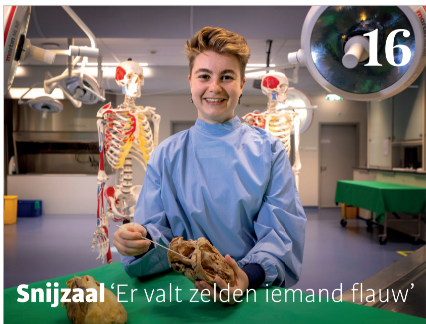
Snijzaal 'Er valt zelden iemand flauw'