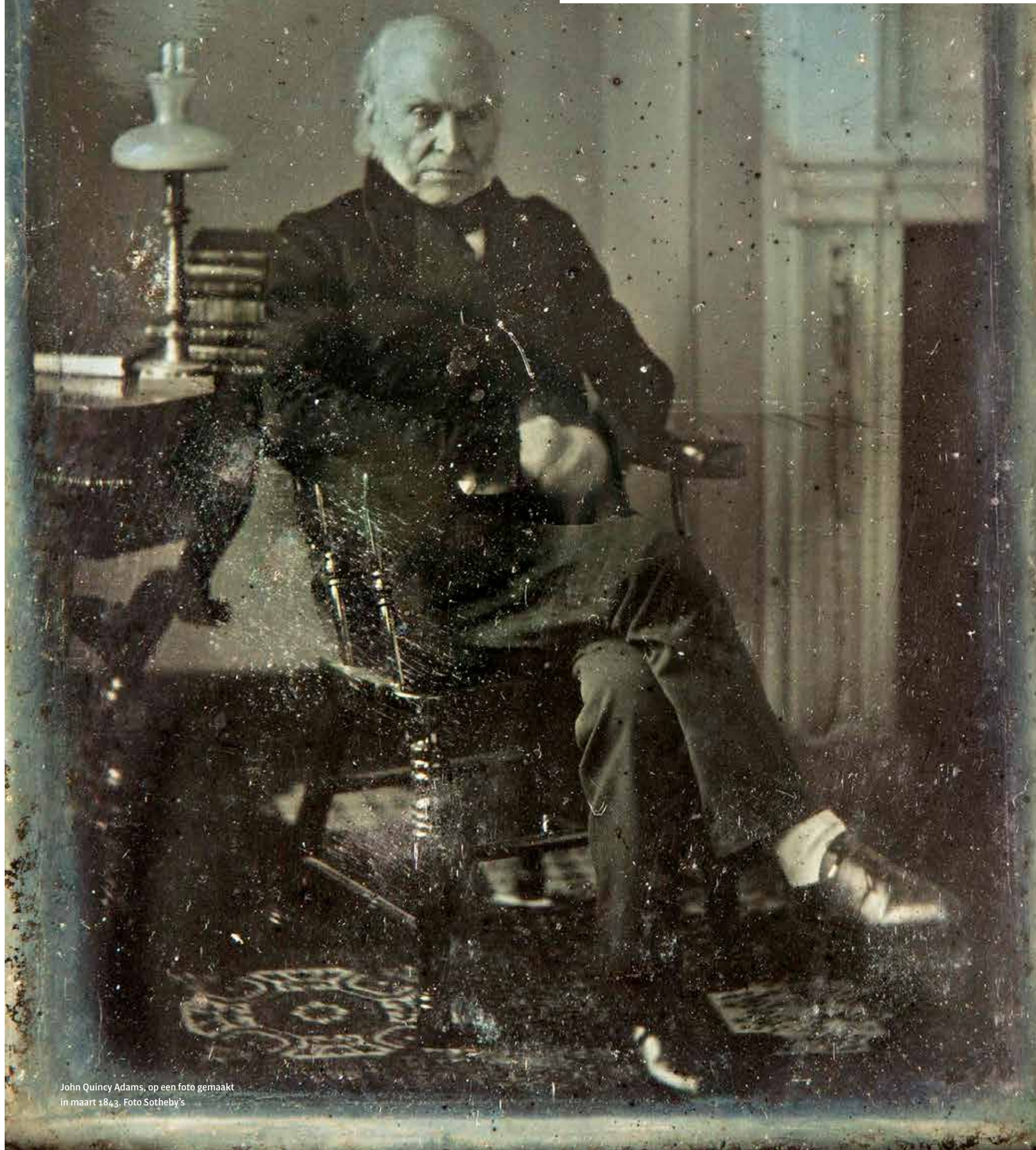
John Quincy Adams, op een foto gemaakt in maart 1843.

Alleen een zwart met witte letters bedrukt bord, ter grootte van een A4'tje, net naast de deur verraadt de historische waarde van het verlepte studentenhuys op de hoek van de Diefsteeg en de Langebrug. De rood-oranje verf op de bakstenen laat op plekken de witte laag eronder zien. De houten kozijnen bladeren af. Op sommige plekken zitten de vensterbanken zelfs los, laat een buurman zien die er een hele balk met één hand uittrekt.