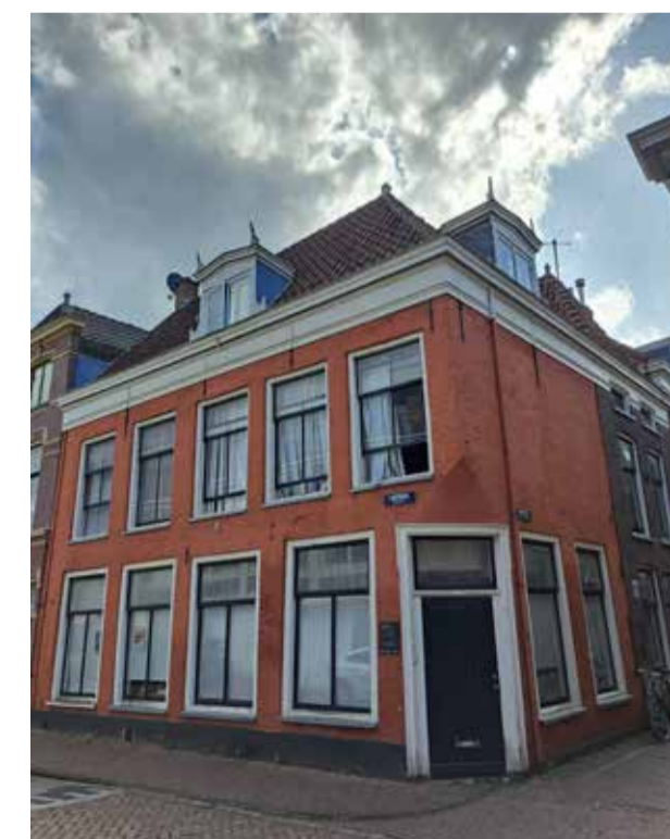
Het huis waarin de tweede en zesde president van Amerika hebben gewoond, op de hoek van de Diefsteeg en de Langebrug.

Voor zijn strenge ouders - advocaat en toekomstig tweede president van Amerika, John Adams, en moeder Abigail - was JQA een doek waarop zij hun eigen torenhoge ambities schilderen. Al voor zijn tiende las hij Griekse filosofen, Romeinse redenaars en eigentijdse Europese denkers in de oorspronkelijke talen. Hiermee drilden zijn ouders de door hun zo vereerde waarden van burgerschap, patriotisme en opoffering in zijn hoofd.