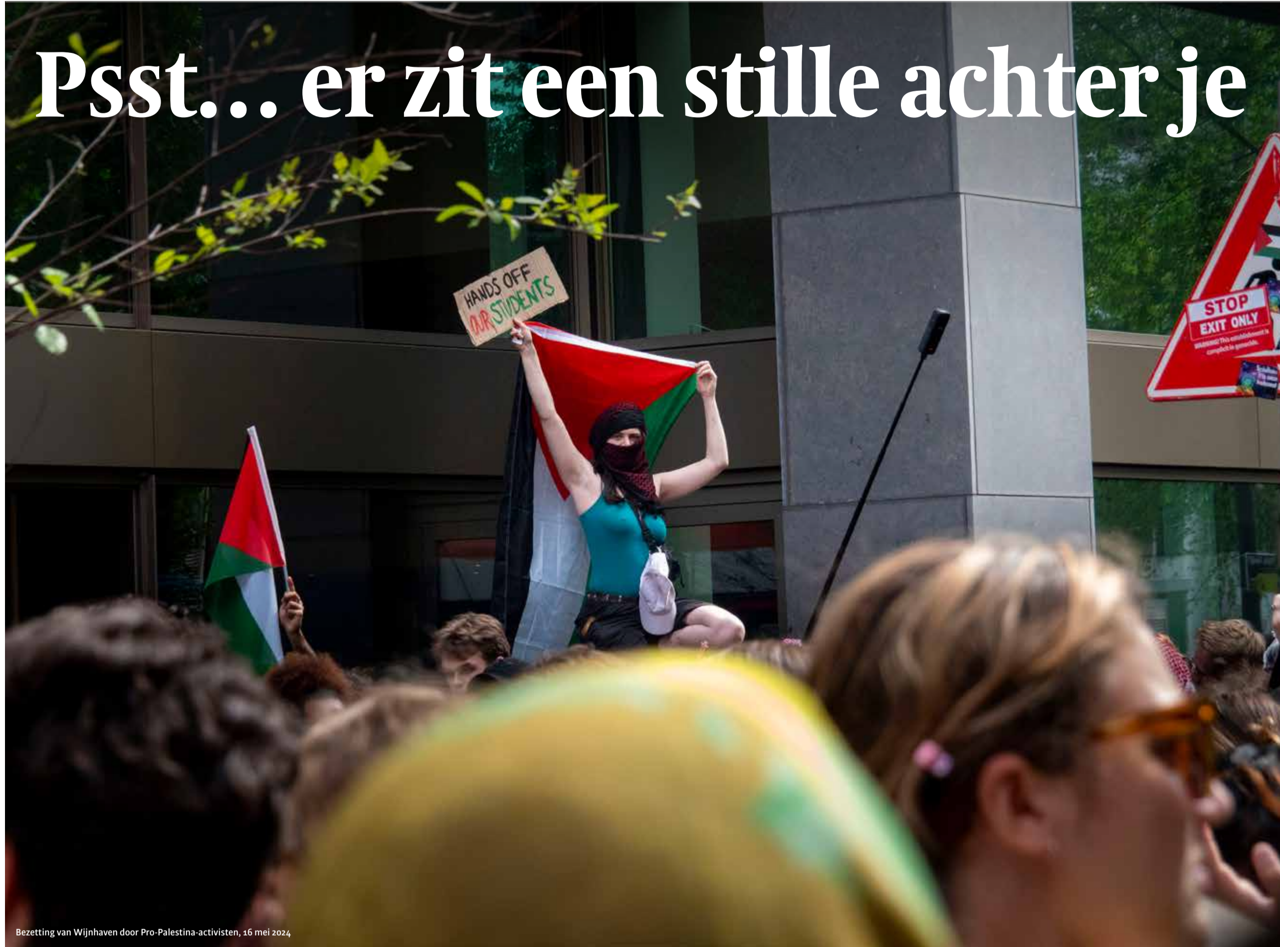
Bezetting van Wijnhaven door Pro-Palestina-activisten, 16 mei 2024

Waarom laat de universiteit studenten schaduwen en fotograferen door beveiligers in burger? Studenten en medewerkers zijn verbijsterd, het faculteitsbestuur schuift 'het pijnpunt' door naar het college. 'Mensen zijn bang om naar college te gaan omdat zij er steeds worden uitgepikt.'