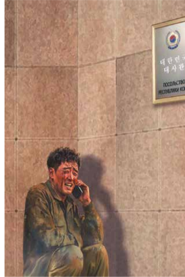
Door een gevluchte Noord-Koreaans getekende briefkaarten

Twee Noord-Koreaanse vluchtelingen vertellen over hun bestaan als dwangarbeider en militair in Rusland. Zelfs op het slagveld is het leven beter dan thuis, vinden veel lotgenoten. 'Soldaten zijn kanonnenvoer, verblind door indoctrinatie.'