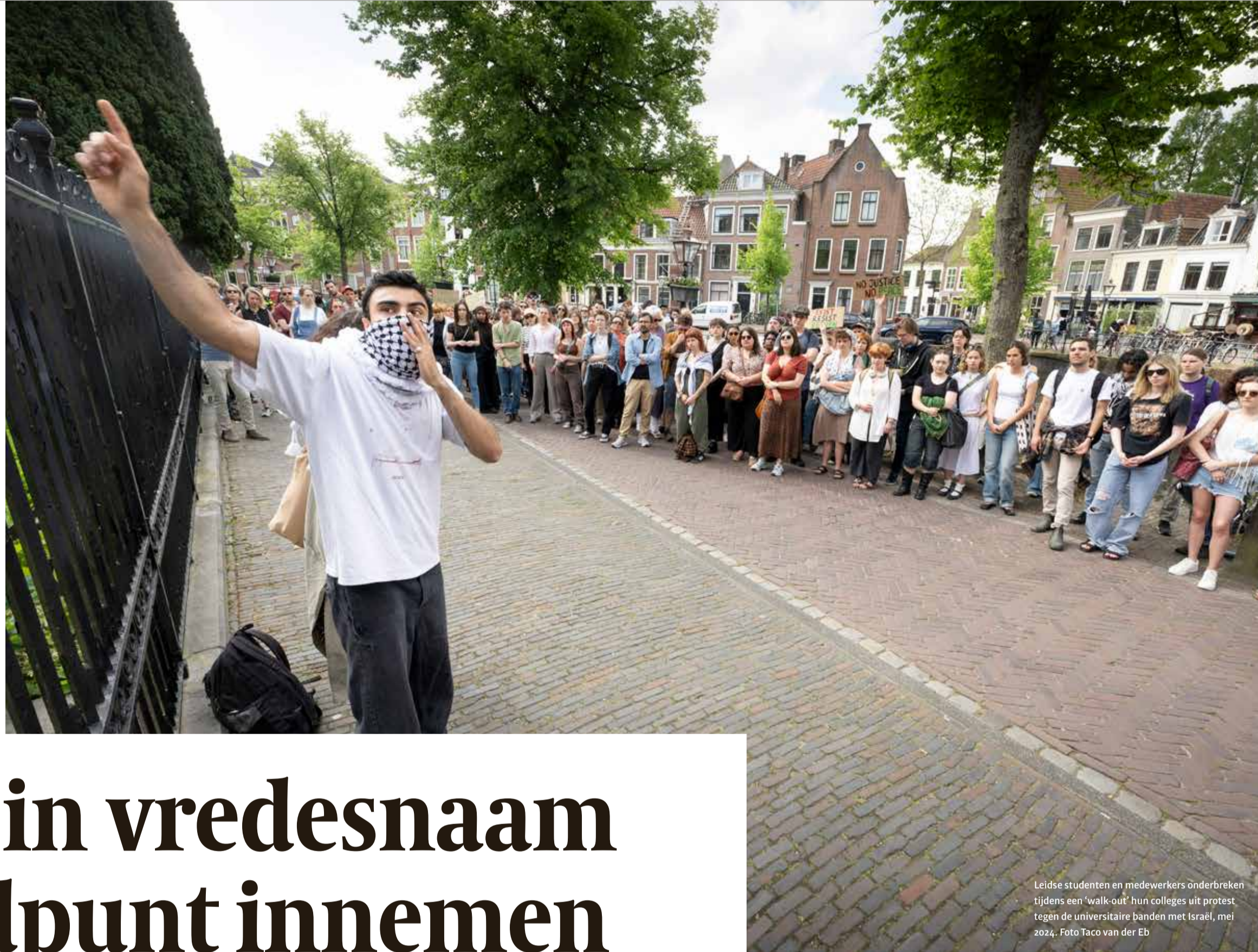
Leidse studenten en medewerkers onderbreken tijdens een 'walk-out' hun colleges uit protest tegen de universitaire banden met Israël, mei 2024.

Past de academie werkelijk nog langer een onpartijdige blik als het over Gaza gaat? Laten we ons niet verstoppen achter de vermeende heiligheid van academische vrijheid, betoogt Geert-Jan Kroes .