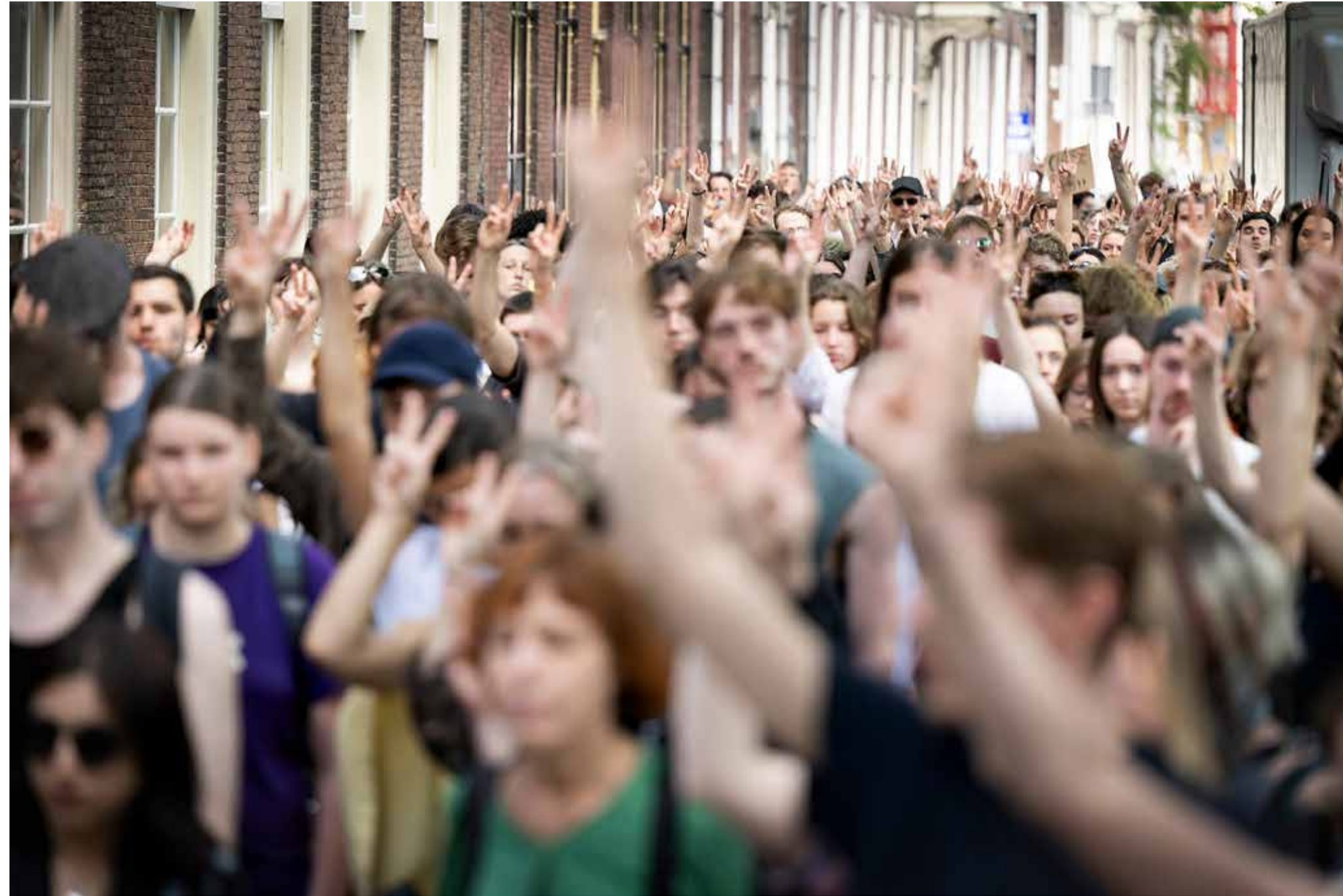
Honderden Leidse studenten en medewerkers onderbreken tijdens een zogeheten ‘walk-out’ hun colleges uit protest tegen de universitaire banden met Israël, mei 2024.