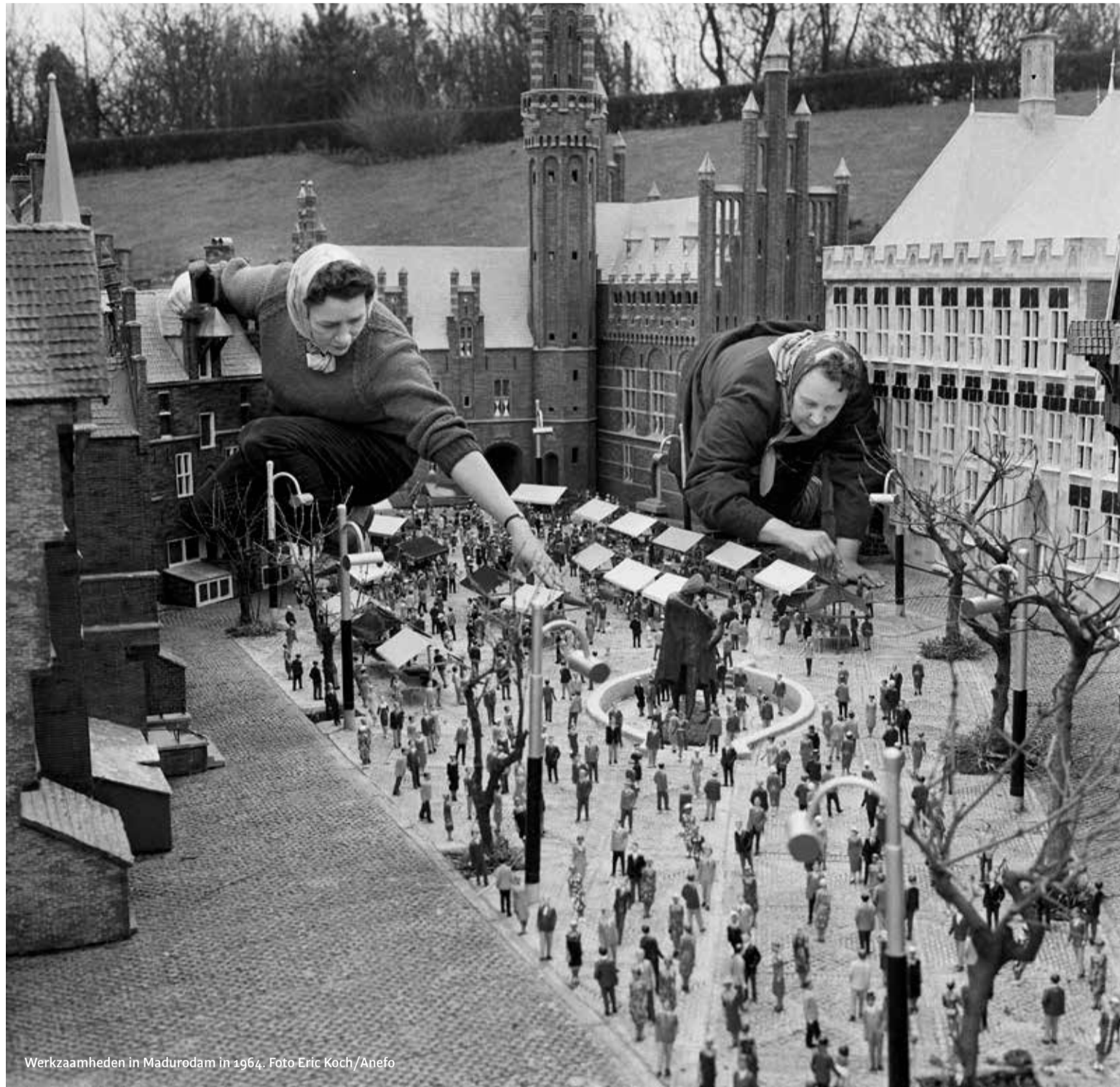
Werkzaamheden in Madurodam in 1964.

Nu Engelstalige opleidingen onder vuur liggen, vrezen studenten van Urban Studies het ergste. Hun interdisciplinaire bachelor mag niet verdwijnen, betoogt Anouk Moritz .