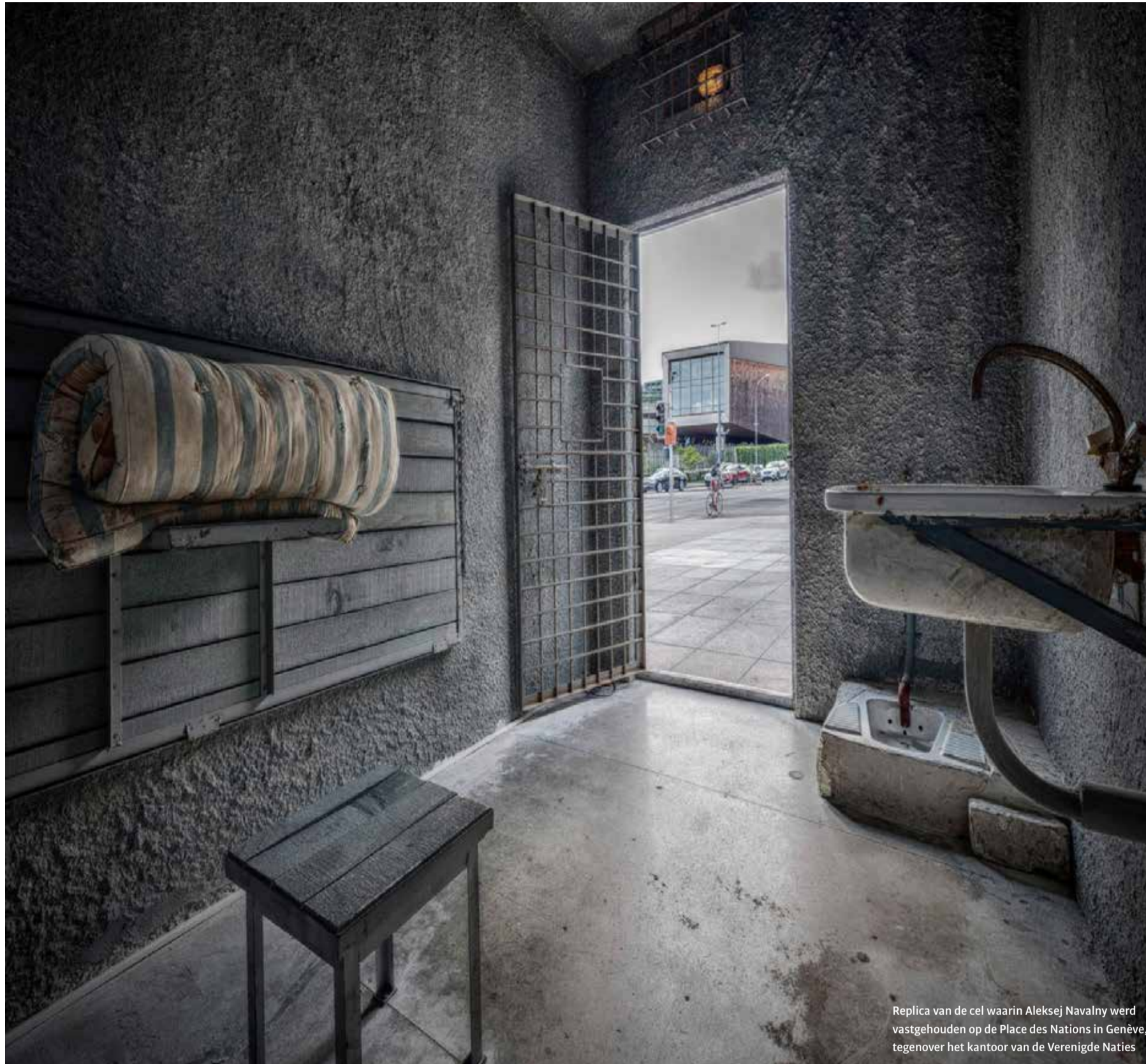
Replica van de cel waarin Aleksej Navalny werd vastgehouden op de Place des Nations in Genève, tegenover het kantoor van de Verenigde Naties

'De grenzen van wat mensen kunnen doen worden door