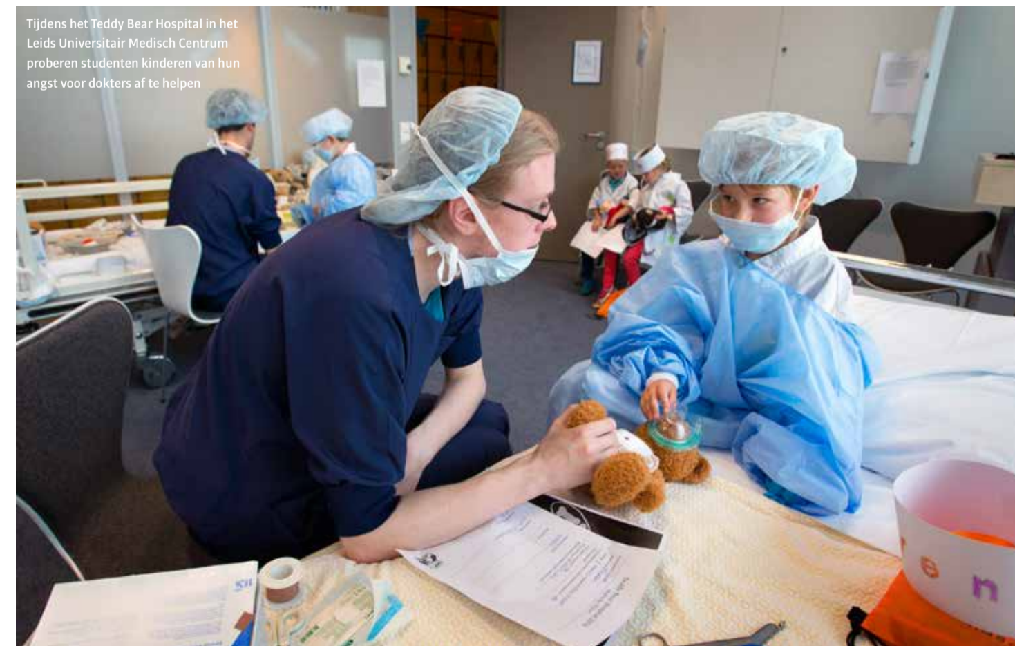
Tijdens het Teddy Bear Hospital in het Leids Universitair Medisch Centrum proberen studenten kinderen van hun angst voor dokters af te helpen

Cosima Nimphy, Led by example: fear transmission from parents to children via social fear learning pathways . Promotie was 24 januari