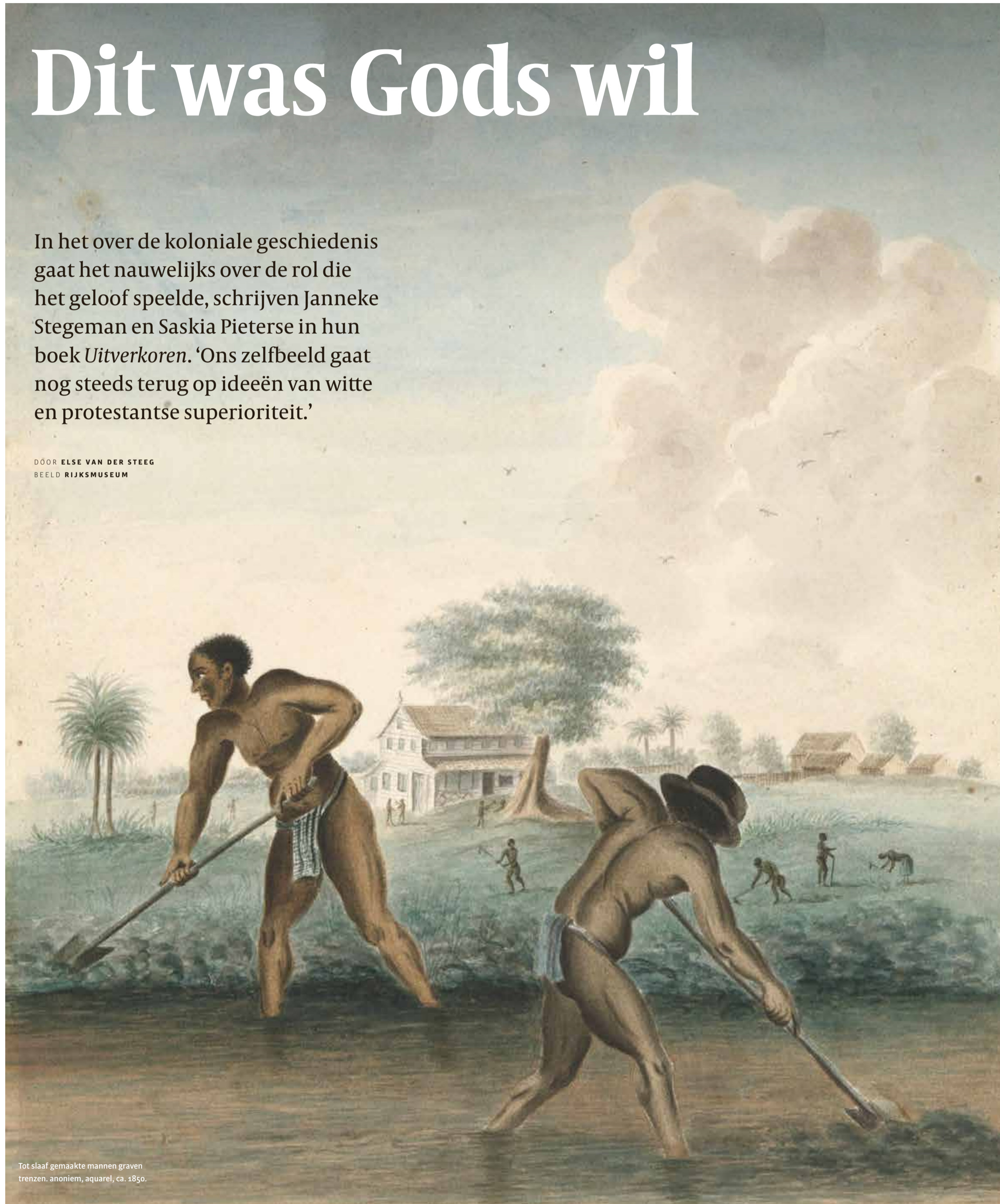
Tot slaaf gemaakte mannen graven trenten. anoniem, aquarel, ca. 1850.

DOOR ELSE VAN DER STEEG BEELD RIJKSMUSEUM