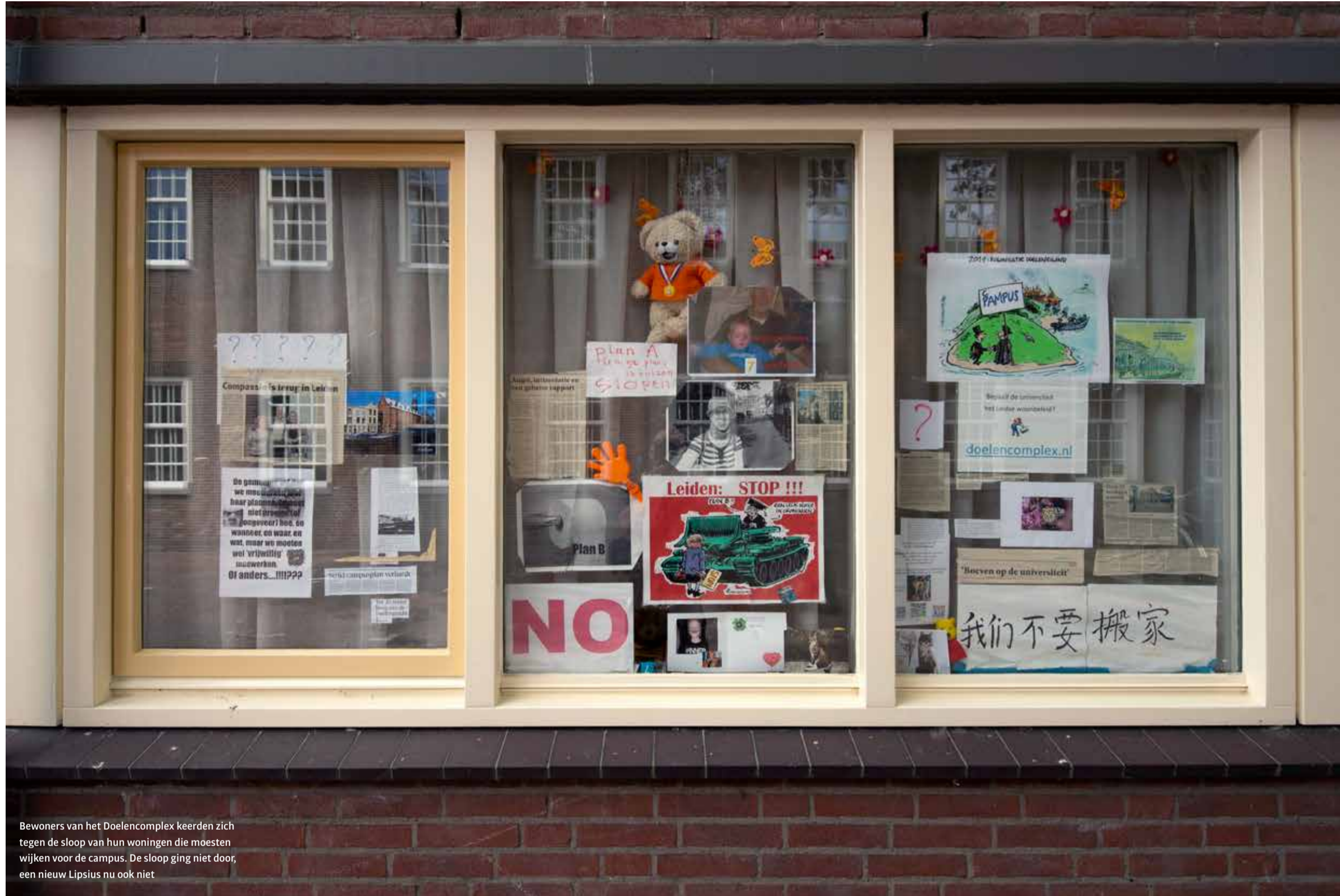
Bewoners van het Doelencomplex keerden zich tegen de sloop van hun woningen die moesten wijken voor de campus. De sloop ging niet door, een nieuw Lipsius nu ook niet

Er komt toch geen nieuw gebouw op de plaats van het huidige Lipsius. Die ‘enorme bezuiniging’ van 14 miljoen euro is nodig, aldus het faculteitsbestuur van Geesteswetenschappen. ‘We willen ons geld besteden aan onderzoek en onderwijs en niet aan gebouwen, dan moet je inklinken.’