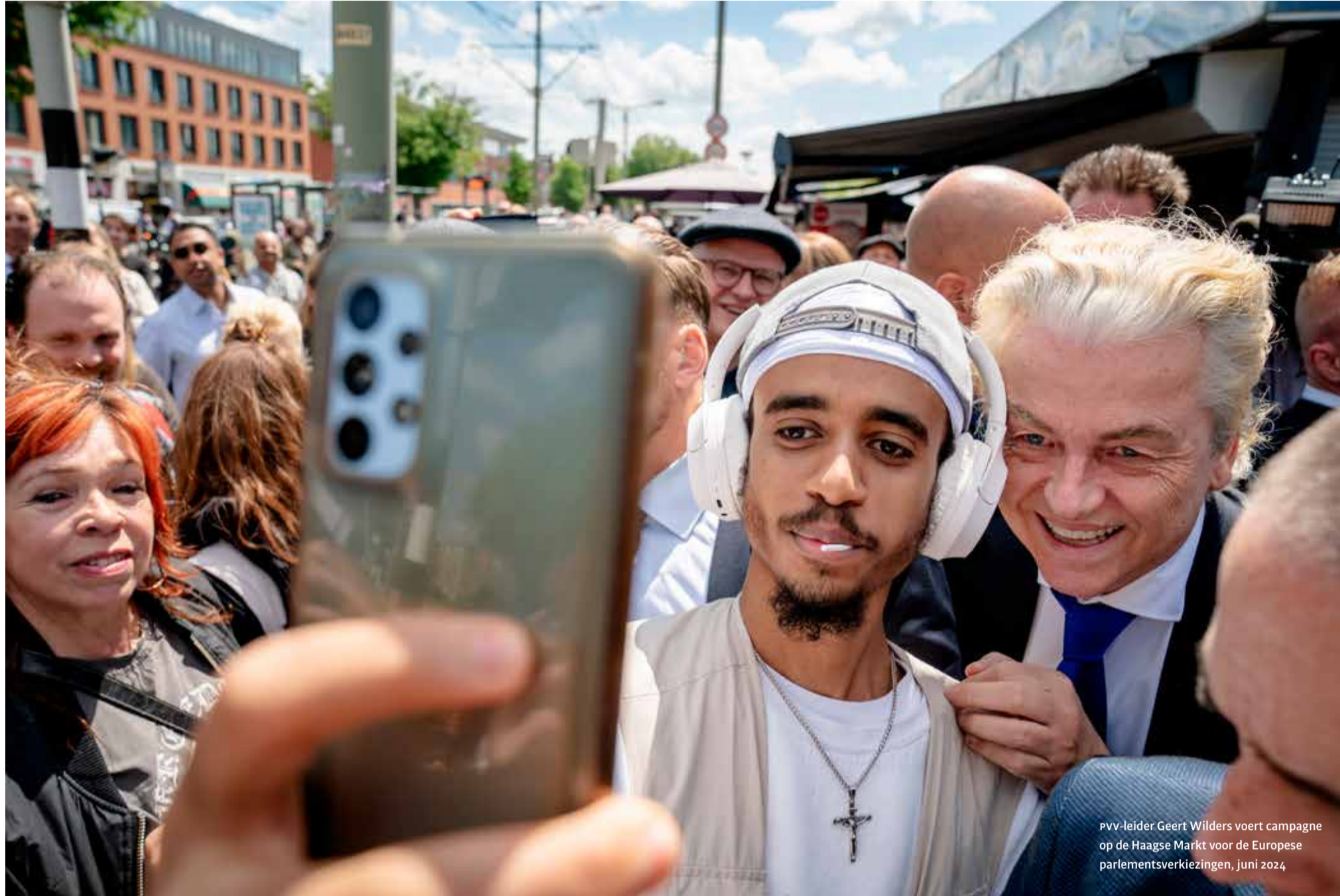
pvv-leider Geert Wilders voert campagne op de Haagse Markt voor de Europese parlementsverkiezingen, juni 2024

Op 3 februari spreekt de raad met het college over de fees.